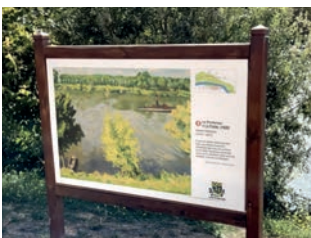
« Clin d'œil d'artistes » Hommage en animation, réalité virtuelle