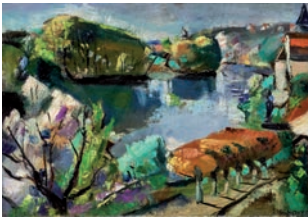
La Seine à La Frette François Desnoyer (1940)