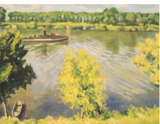
Printemps à La Frette Albert Marquet (1935)